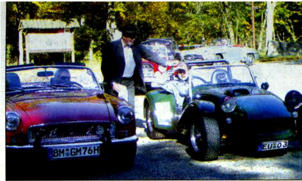
■ Anhänger historischer Fahrzeuge kommen beim "EuRegionale 2008"-Bürgerfest ebenfalls auf ihre Kosten. Am Samstag präsentieren die "Oldtimerfreunde Zülpich" von 14 Uhr bis 19 Uhr am Weiertor ihre alten Schätzchen.

>> Für diese Veranstaltung hat die Zülpicher Doppelweltmeisterin Silke Rottenberg die Schirmherrschaft übernommen. Die sympathische Ex-Nationaltorhüterin wird auch eine Autogrammstunde geben.